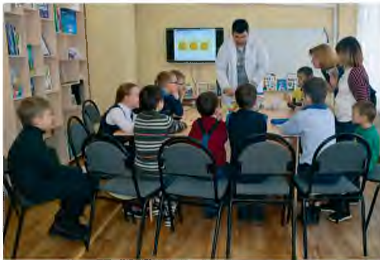
Решайте с детьми головоломки, советуют математики