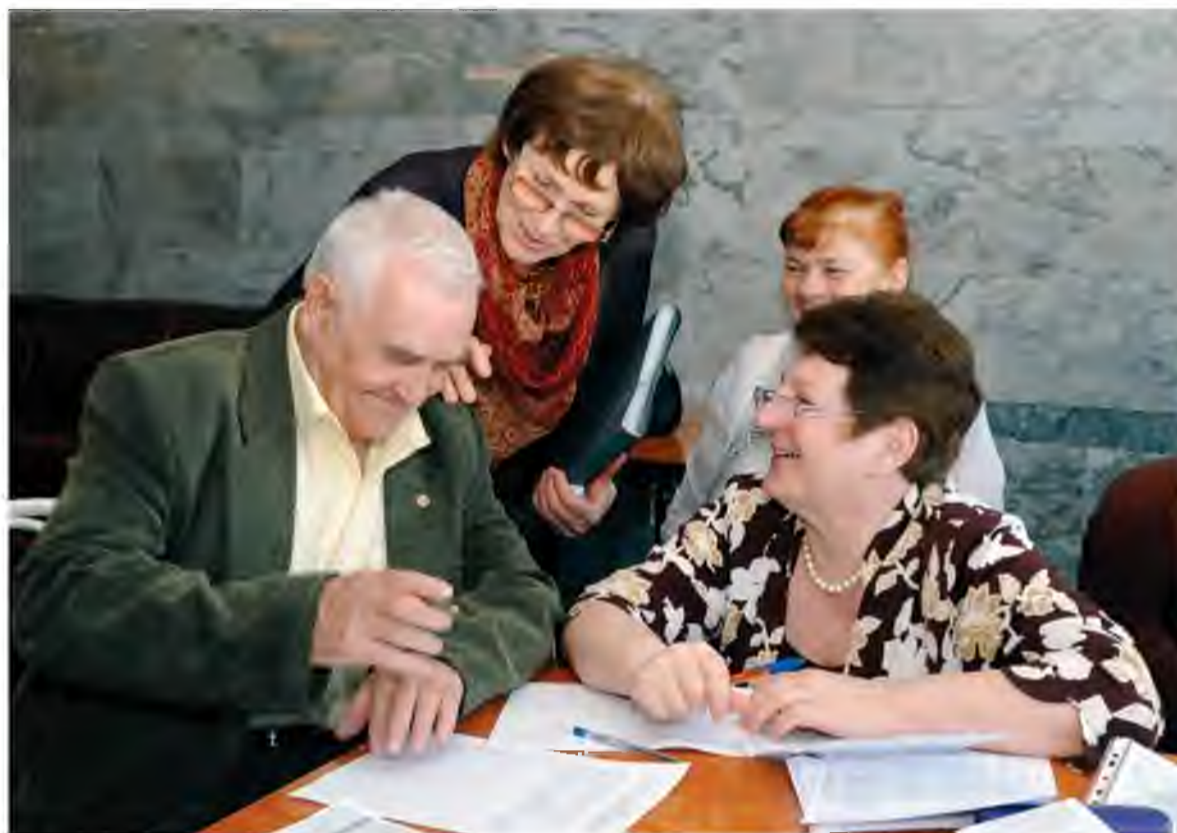
Совет ветеранов ТОАЗа располагается в ДК «Тольяттиазот» (кабинет №417). Время работы с ветеранами: вторник и четверг с 10.00 до 14.00

Работа Совета ветеранов направлена на поддержание связи между заводским коллективом и ветеранами предприятия, находящимися на заслуженном отдыхе. Для пожилых людей внимание особенно важно.