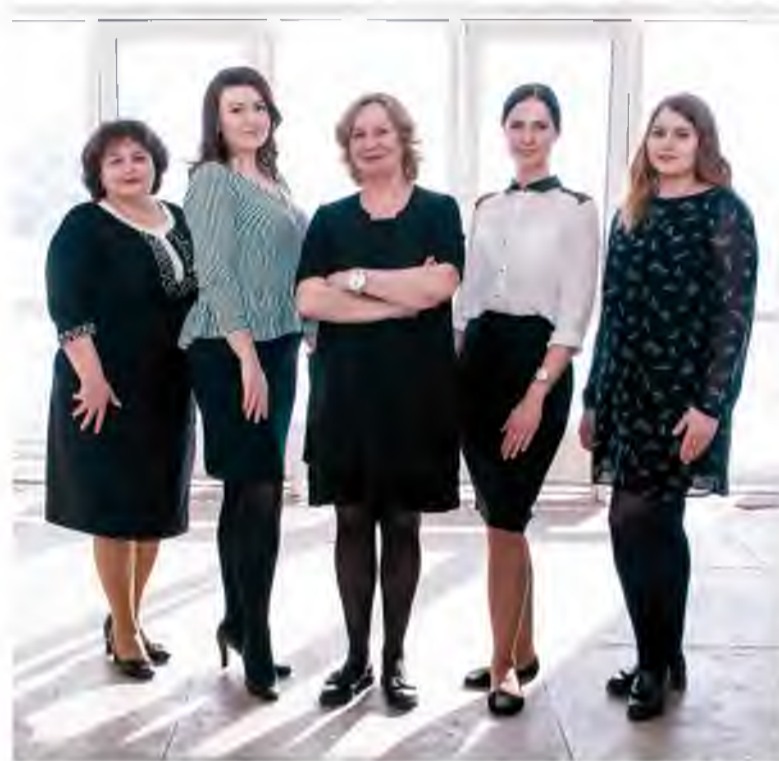
В отделе таможенного оформления рейд не выявил отклонений от дресс-кода

– На этот раз фиксировать нарушения не стали. Рейд носил,