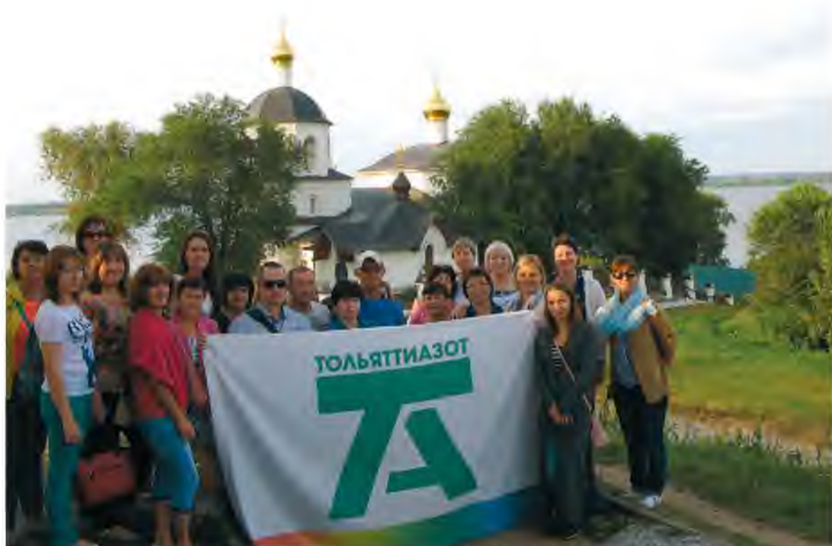
Отправляясь в путешествие, наши коллеги заново открывают для себя Поволжье и Россию

– Планов много, идей – не меньше, – улыбаются организаторы турпоездок. – Всего год назад даже не думали о таком, а сейчас есть уверенность в том, что состоятся и более дальние и длительные путешествия.