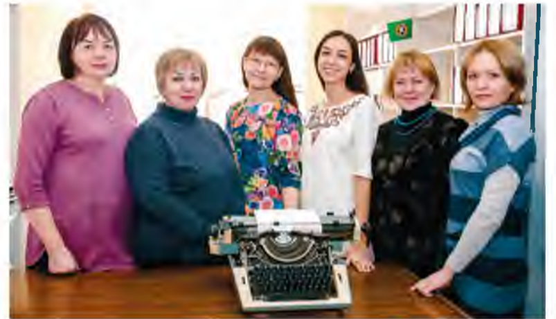
Накануне своего профессионального праздника сотрудники технического архива ТОАЗа передали в музей механическую пишущую машинку