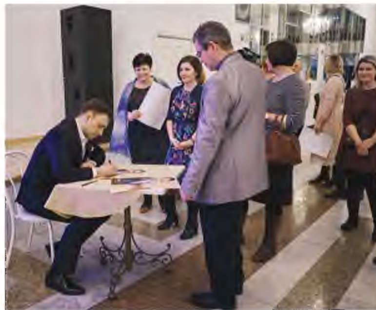
Автограф-сессия с любимым артистом собрала поклонников разных возрастов